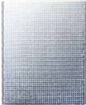
持ち手なしタイプ